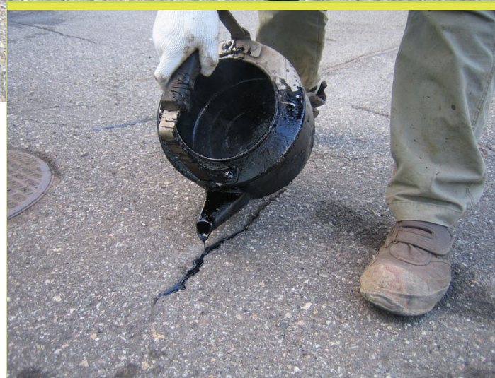
従来のヤカン工法