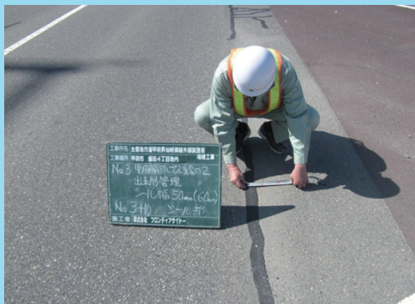
平成 25 年 1 月施工