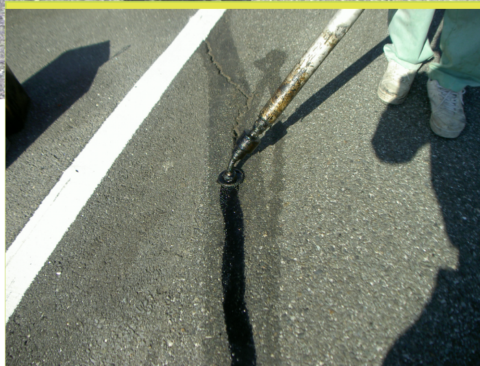
シール注入機：EZメルター