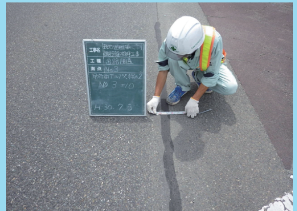
平成 30 年 7 月現地調査